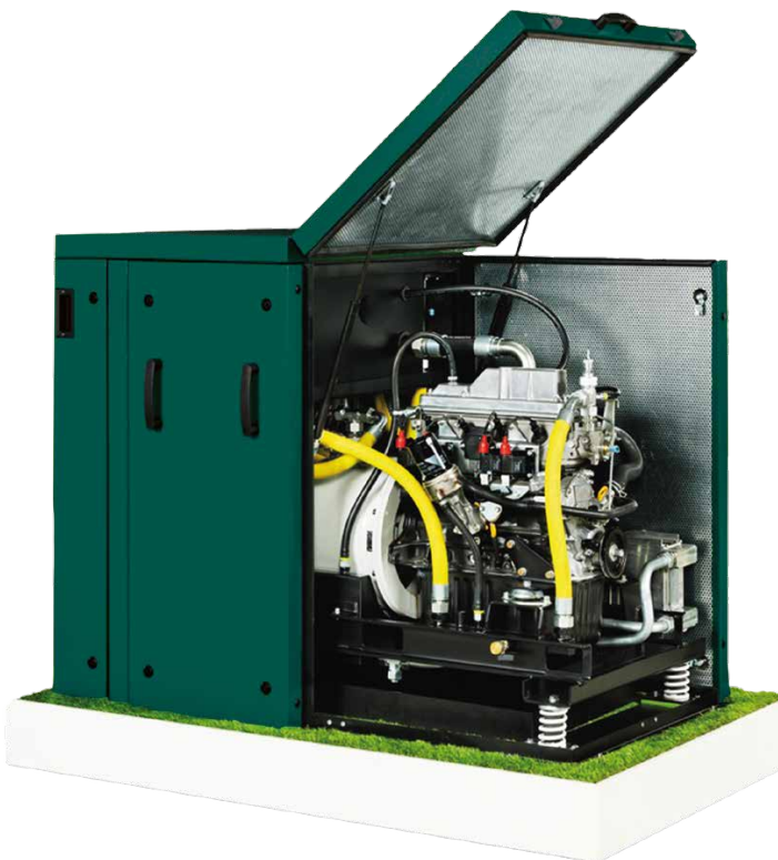
Dachs Pro G/F20.0

Die doppelte Nutzung des eingesetzten Brennstoffs macht die Kraft-Wärme-Kopplung hocheffizient. Bei dem neuen Dachs Pro G/F20.0 liegt der Gesamtwirkungsgrad bei bis zu 102,4 Prozent. Damit erzielt die Anlage die Energieeffizienzklasse A++ und ist langfristig eine sichere Option für niedrige Energiekosten, unabhängig von den steigenden Preisen des Energiemarktes.